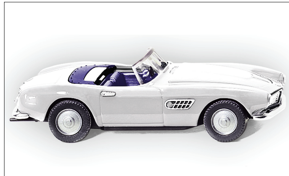
10. Münster Classics 2010

Das Modell ist bei Drucklegung noch nicht fertig. Sie sehen es auf unserer homepage.