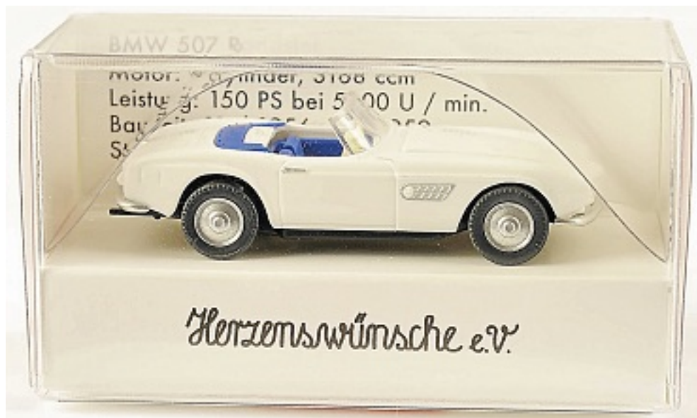
Damit werden Herzenswünsche wahr: Zur zehnten Auflage der Münster Classics wurde ein BMW 507 als exklusives Wiking-Sondermodell aufgelegt.

grau auf Oldtimerfelge. Das Fahrzeug ist unbenannt. In der Umverpackung sind die technischen Daten des Originals aufgenommen. Von jedem verkauften Modell, das auch den Besuchern der Veranstaltung angeboten wird, geht ein Euro an den Verein Herzenswünsche. Im vergangenen Jahr kamen so – zur neunten Münster Classics wurde ein Mercedes-Benz 280 SL Pagode als exklusives Wiking-Sondermodell aufgelegt – über 500 Euro zusammen, die als Spende in die Arbeit der gemeinnützigen Organisation flossen.