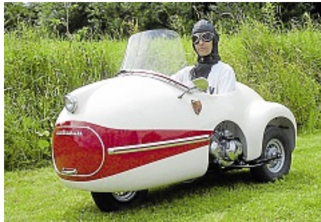
Im Jahr 1957 wurde von der Firma Brüttsch das Mopetta in einer Auflage von nur 14 Exemplaren gebaut. Eines davon wird am Wochenende in Münster an den Start gehen.