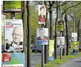
Wahlplakate an einer Hauptverkehrsstraße

Nachdem bereits das rote Ausrufezeichen in entlegensten Wohnvierteln der Stadt auftauchte, sind jetzt sogar die neuen Plakate in verkehrsberuhigten Spielstraßen (z.B. Siedlung Normannenweg in Angelmodde) zu fin-